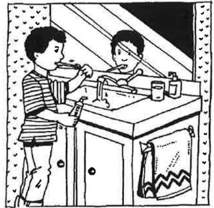
The habits that your child forms in early childhood last a lifetime.