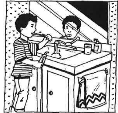
Los hábitos que su hijo/a forma en la edad temprana duran para toda la vida.

Aquí tiene algunas guías que los profesionales en cuidado dental recomiendan que los padres sigan para ayudar a que sus hijos preescolares formen hábitos dentales saludables.